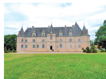
Ch. (ea) de F /i e