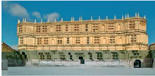
Gâig" a" : Ch. (ea)

Le 14 juin, sortie groupée avec la journée GVR Rhône-Alpes, sera la découverte de Grignan et son château , lequel, propriété du département de la Drôme est classé monument historique. Deux guides du patrimoine nous accompagnent en ce Palais Renaissance qui accueille la Marquise de Sévigné venue rendre visite à sa fille, alors châtelaine des lieux, en trois séjours de 4 ans en tout. C'est sa petite fille qui regroupera la fameuse et abondante correspondance (mère et fille) qui fera le bonheur de la littérature descriptive d'une époque.