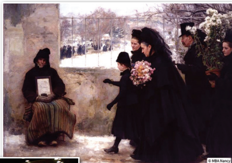
celle du tableau "la Toussaint" d'Emile Friant

suivie par celle de la collection Daum qui nous a donné un très bref aperçu de ce qu'a été l'École de Nancy.