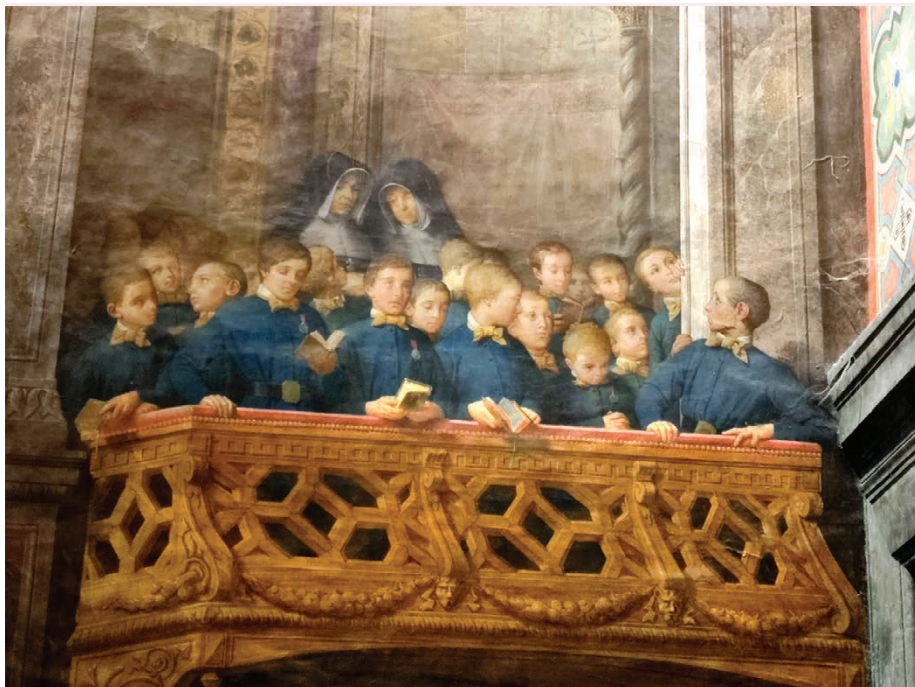
Lenepveu : Balcon des orphelins - Chapelle CHU Angers