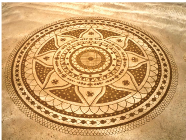
Œuvre éphémère sur une plage vendéenne par Michel Jobart

L’AFFV participe à la peine des familles éprouvées par la perte d’un être cher.