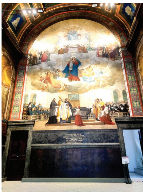
La fresque monumentale qui fut peinte derrière l'autel rend hommage aux personnalités angevines et bienfaitrices.

Menacée de destruction, elle fut classée aux Monuments Historiques et restaurée. Elle sert actuellement d'accueil de jour pour l'hôpital (avec quelques ajouts contestables...). Sa coupole domine toujours le CHU d'Angers.