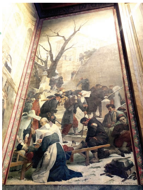
La dernière fresque fut peinte en 1878. Elle rend hommage aux blessés de la guerre contre les Prussiens. L'hôpital servait de base arrière.

Certaines peintures "de chevalet" sont visibles dans différents musées : Orsay, Quimper, Rome, Le Louvre mais surtout à Angers. Heureusement des dessins préparatoires à ses œuvres monumentales sont visibles.