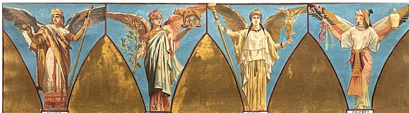
Allégories de l'escalier Daru

Certaines peintures "de chevalet" sont visibles dans différents musées : Orsay, Quimper, Rome, Le Louvre mais surtout à Angers. Heureusement des dessins préparatoires à ses œuvres monumentales sont visibles.