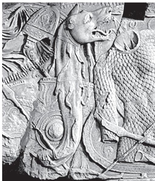
Colonne Trajan (Rome)

Or, dans la mythologie grecque, les dragons étaient un groupe de serpents de grande taille, parfois dotés d'un souffle empoisonné ou d'un grand nombre de têtes, affectés par les dieux à la garde de trésors ou de lieux sacrés. Mais ils ne crachaient pas le feu.