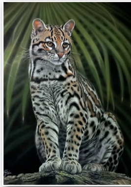
Fabrice LEDUC : Le visiteur du soir, Pantanal